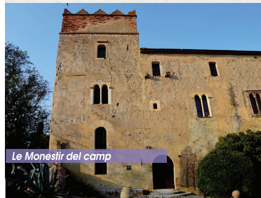
Le Monastir del camp