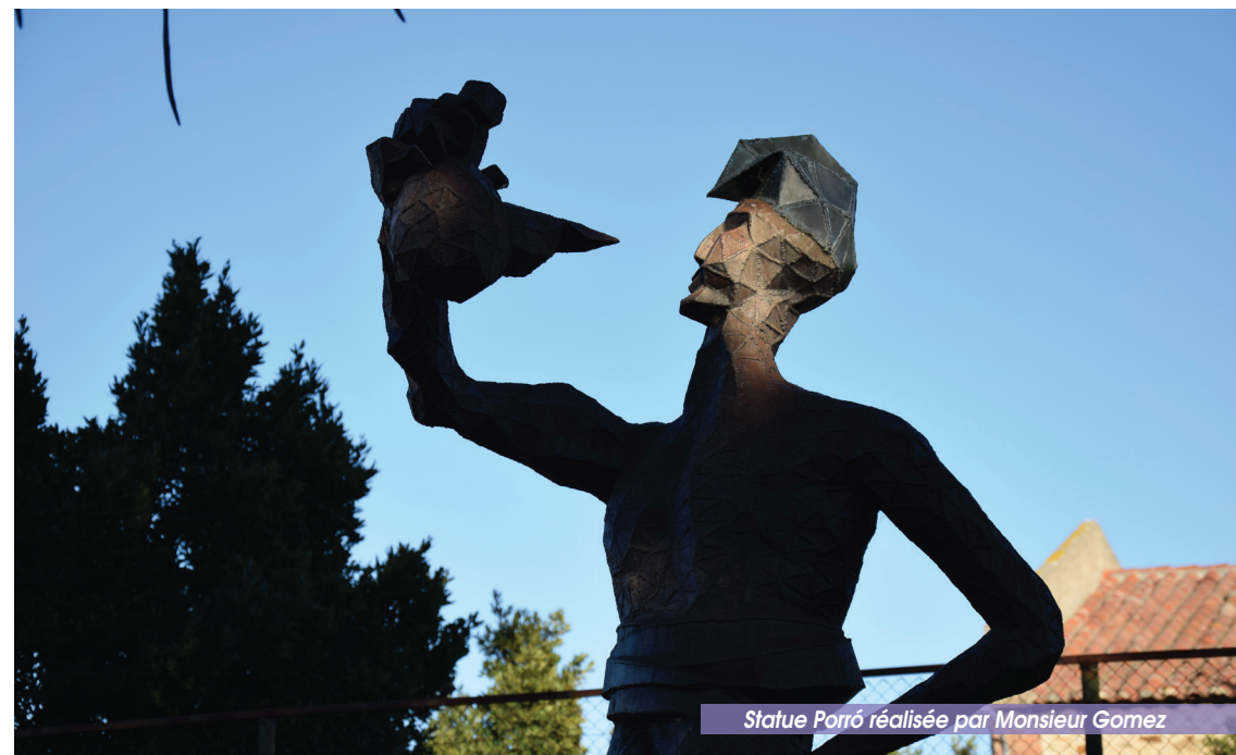
Statue Porró réalisée par Monsieur Gomez