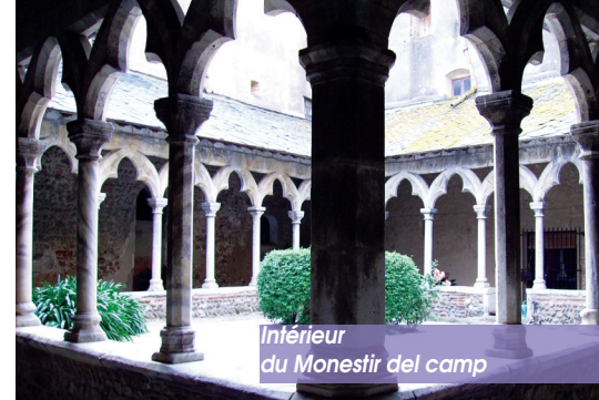
Intérieur du Monastir del camp